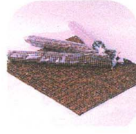
javitási és hobby célból