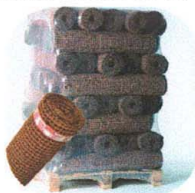
„ stauss -páncél”

hosszúság = kb. 5m szélesség = kb. 1m súly = kb. 5kg/m 2