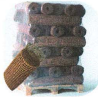
speciális a „ Thermo -homlokzatnál”