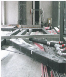
Trennlage und Estrich